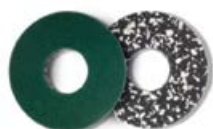
2 x PU Longlife PowerPad 203 mm Art.-Nr. 110011V