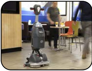
Sicherer Stand durch breite Parkposition