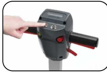
Einfach & klar in der Bedienung – besonders anwenderfreundlich durch farbcodierte Bedienelemente