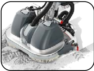
Perfekte Absaugung – sofort trockene Böden.