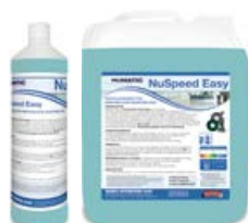
NuSpeed EASY Spezialreiniger für empfindliche Bodenbeläge 1 Liter (1 VE = 12 Flaschen), Art.-Nr. 121404 5 Liter (1 VE = 2 Kanister), Art.-Nr. 121405