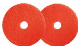
NuPad rot 203 mm (1 VE = 10 Stk.) Art.-Nr. 130053