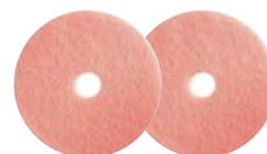
NuPad Super Classic 203 mm (1 VE = 5 Stk.) Art.-Nr. 130051