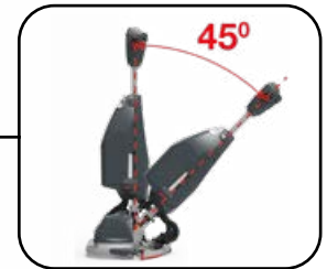
Leicht bewegliche Deichsel – ermöglicht ein ergonomisches und einfaches Arbeiten