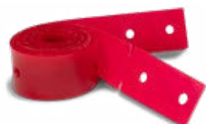
Gummilippen-Set, komplett Art.-Nr. 913810V