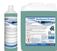
NuSpeed Power Spezialreiniger für Hartböden 1 Liter (1 VE = 12 Flaschen), Art.-Nr. 121407 5 Liter (1 VE = 2 Kanister), Art.-Nr. 121408