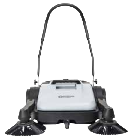
SW200 mit einem Seitenbesen und SW250 mit zwei Seitenbesen bieten Arbeitsbreiten von 70 cm bzw. 90 cm.