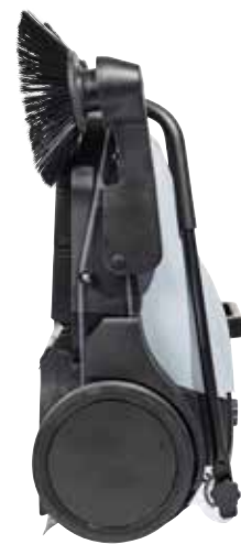
Der Kehrgutbehälter bleibt an Ort und Stelle, auch wenn die Kehrmaschine in einer aufrechten Position aufbewahrt oder an die Wand gehängt wird.