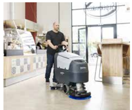
Die Nilfisk SilentTech™ Technologie verringert den Schallpegel auf 65 dB (A) – und im Silent-Modus sogar auf bis zu 60 dB (A)