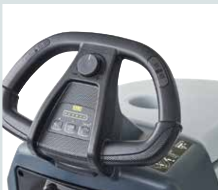
Ergonomischer Griff mit Touch-Sensoren, OneTouch™ Taste und Anleitungsaufkleber erleichtern dem Anwender den Einstieg in die Bedienung