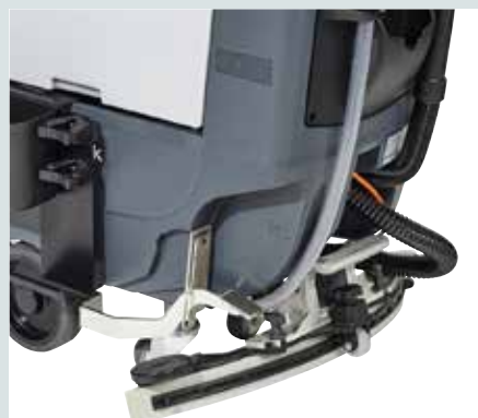
Höchste Saugleistung mit der gebogenen Saugleiste