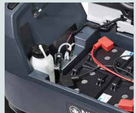
Das Mischsystem für Reinigungsmittel bietet dem Bediener die Möglichkeit, nur mit Wasser zu reinigen und Reinigungsmittel nur bei Bedarf hinzuzufügen